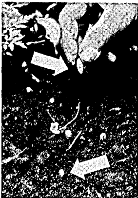
(撮影地：インドネシア) 種子。

普通播種は、種子巾の2~3倍の覆土を常識とする。チョウジの場合は、播種のとき土に埋めることを全くしないで、種子の臍の部分を下にして立てて倒れない程度(種子の \frac{1}{2} 程)土の中に差し込むだけとする。播種床の場合、普通3×3、又は3×5cm間隔とする。上記の方法で播種すれば、10日程で立てた種子から根が伸長して土中に入り、20日程で頂部