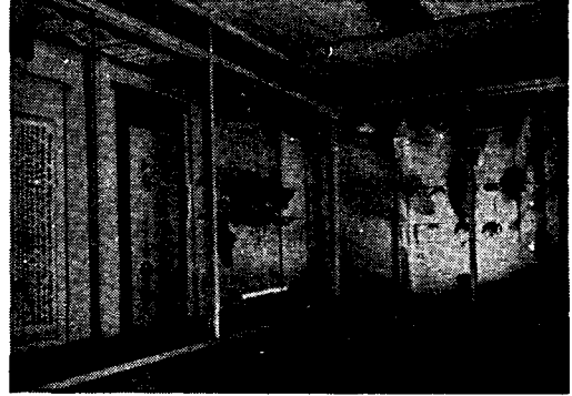
(考古館内の展示室)