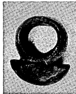
〔ヒスイ指輪；縄文時代〕

当館の目玉展示物は、何とんでも「縄文時代のヒスイ指輪」と称せられている大野郡丹生川村旗鉢出土の遺物であろう。それから、同じ