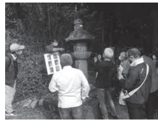
石仏ツアーと機関紙記事

市内外の参加者に混じって、該当地区のまちづくり協議会のメンバーが一人参加し、担当学芸員の解説を熱心に聴いていた。その参加者は、「普通」にあるその石仏が、歴史的に貴重な価値があることを初めて知り、それに触発されて地区の「ほこり」としてツアー直後の会の機関紙で紹介してくれた。個人としての気付きが、地域住民としての誇るべきアイデンティティの一つとなって、まちへの触発に繋がって言えば、きっかけとなった博物館の展示やツアーの意義はとても大きなものになる。