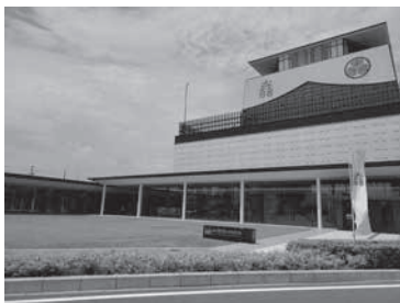
櫓をイメージした岐阜関ヶ原古戦場記念館

平成27年3月、岐阜県と関ヶ原町により、関ヶ原古戦場の整備を行うとともに関ヶ原の戦いをより分かりやすい形で発信し、古戦場を中核とする広域観光の推進を図ることを目的とした「関ヶ原古戦場グランドデザイン」が策定されました。その拠点施設である岐阜関ヶ原古戦場記念館が、令和2年10月に開館しました。