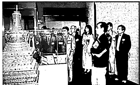
翌日の見学風景（岐阜市歴史博物館にて） （事務局）

明智町に美術館を開いて10年になるが、一人旅の青年や毎年夏になると来る男性などいろいろな人との触れ合いがある。一番大事なことはお客さんの満足である。個人経営の美術館なので、管理運営に向け、広報や美術館・博物館のビジョンについて聴ける機会、資料の収集・展示・保管の方法（特に劣化対策）等の指導など行政の支援をお願いしたい。