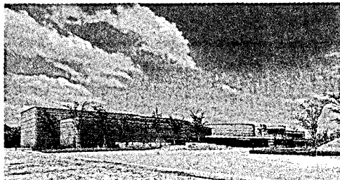
東海三県博物館交流研修会 会場 斎宮歴史博物館

また、講演の後、「館における防災対策」をテーマに、研究協議が行われ、各県の代表者が